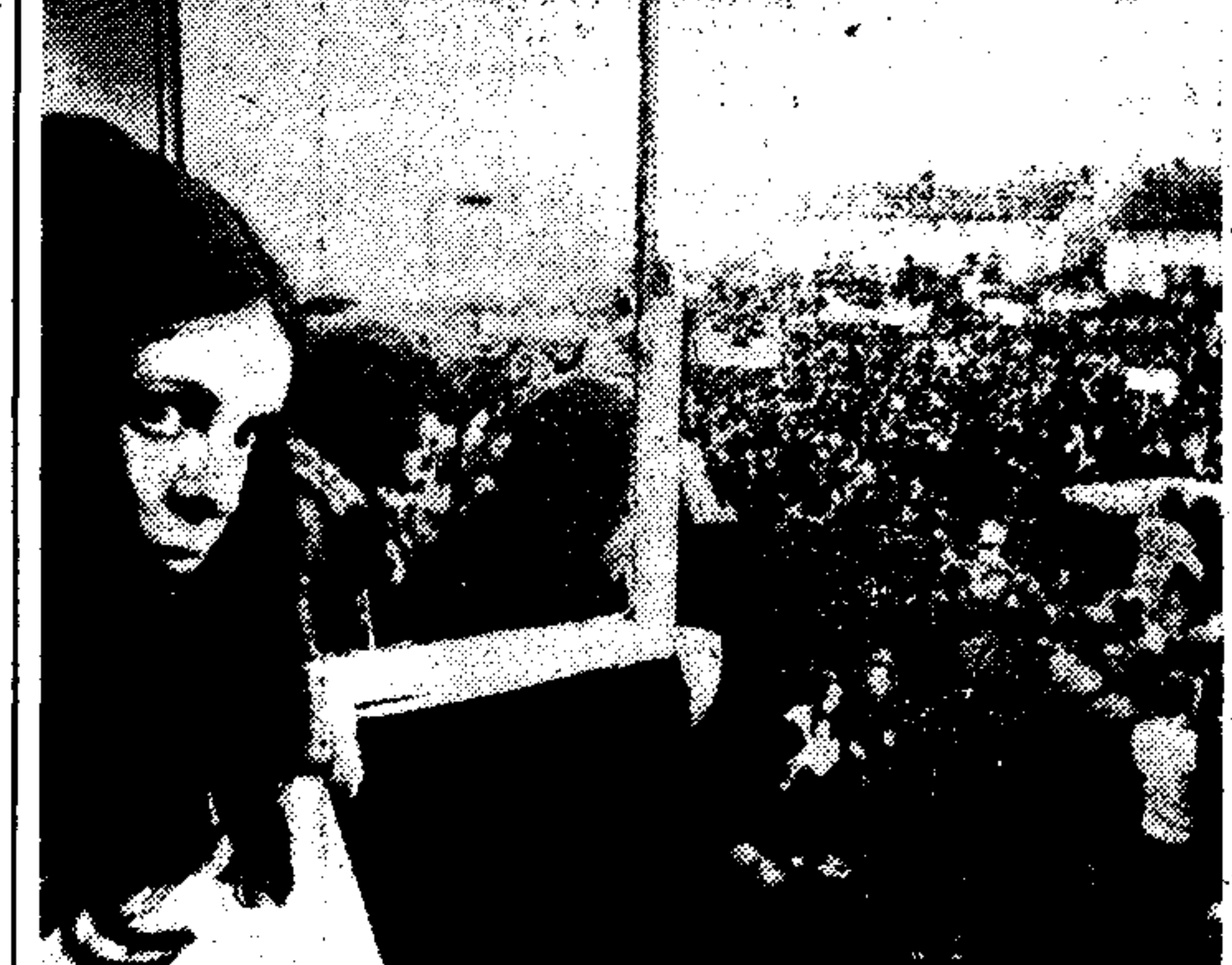
Η δυναμική βορειοηπειρωτική βουλευτίνα Μπριτανάντε Ντέβλιν, παρακολούθησε από ένα περσίδιο τό πύλη που συγκροτήθηκε για νά πέρασουν μέρος από τή μεγάλη διαδήλωση διαμαρτυρίας του Νιούρυ...